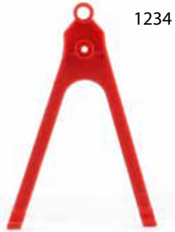
1234 XARD RED