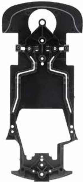
AW Black standard